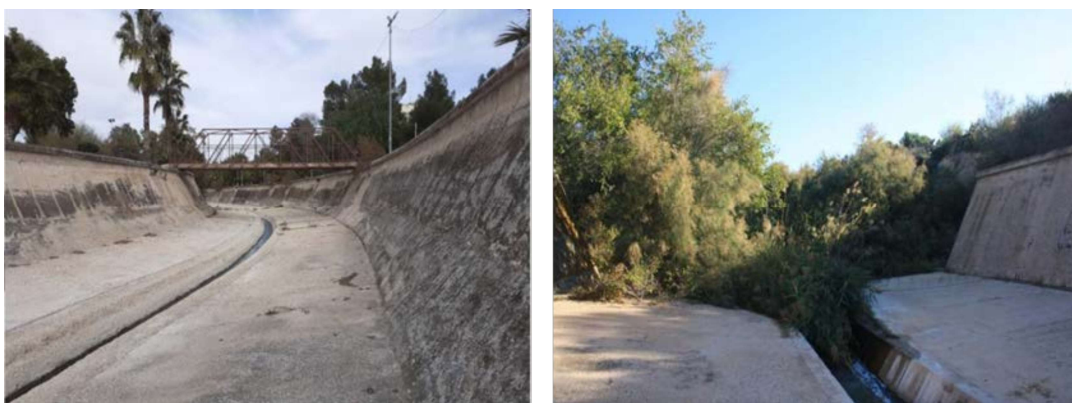
Figura 2. Tramo urbano de Elda: izquierda, aspecto general de la canalización; derecha, inicio del tramo.