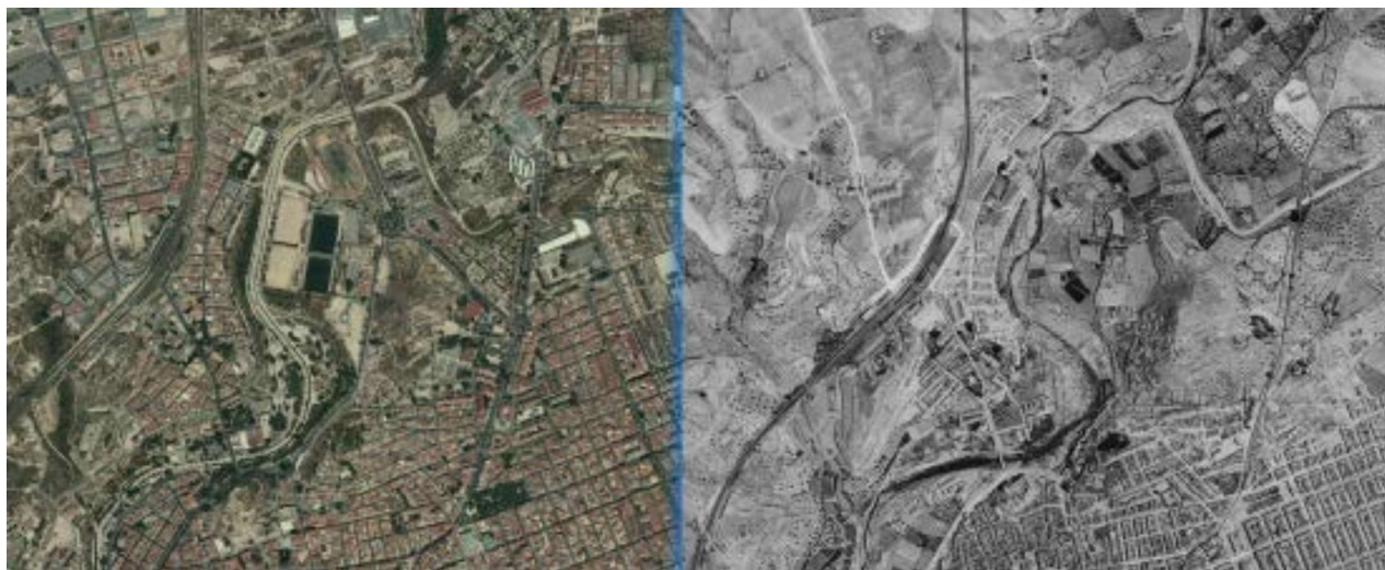
Figura 3. Comparativa entre ortofotografía aérea de máxima actualidad (2017), izquierda, y ortofotografía aérea del vuelo americano serie B (1956/57), derecha, en la parte superior del tramo urbano de Elda.

planta del río en Elda en ambos periodos para obtener el área de cauce mojado y de bankfull en el tramo urbano, la longitud del thalweg y el índice de sinuosidad (Tabla 1). Asimismo, el riesgo de inundación en el tramo urbano se ha extraído de la información procedente del Plan de Acción Territorial para la Prevención del Riesgo de Inundaciones en la Comunidad Valenciana (PATRICOVA). Para la propuesta de las alternativas de renaturalización el río se ha dividido en cuatro subsegmentos, teniendo en cuenta así las limitaciones de cada uno de ellos.